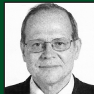
TIZIANO TREU Professore Emerito di Diritto del lavoro nell'Università Cattolica del Sacro Cuore di Milano