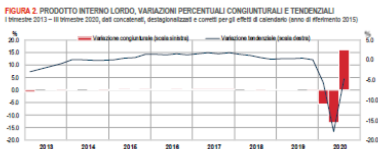
Figura 1. Dinamica del PIL – stime ISTAT (variazioni congiunturali e tendenziali)